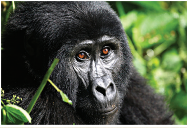
Gorille de montagne